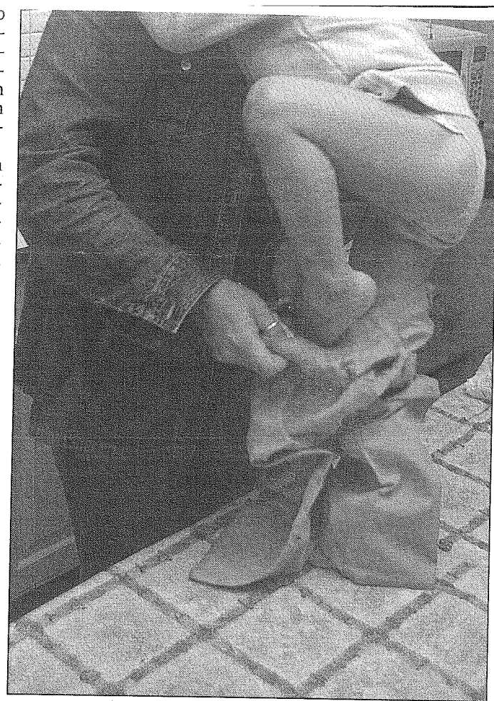
Een papa helpt zijn slaperige zoontje 's ochtends in de kleren. "Laat jonge ouders de kans en de keuze om een jaar thuis te blijven, en betaal ze daar goed voor", suggereert de Gezinsbond.